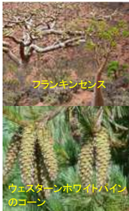
フランキンセンス

Victoria見聞録ダウンロード&ビューサイト： http://victoriakenbunroku.weebly.com