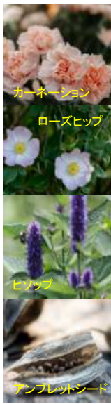
カーネーション ローズヒップ

Victoria見聞録ダウンロード&ビューサイト： http://victoriakenbunroku.weebly.com